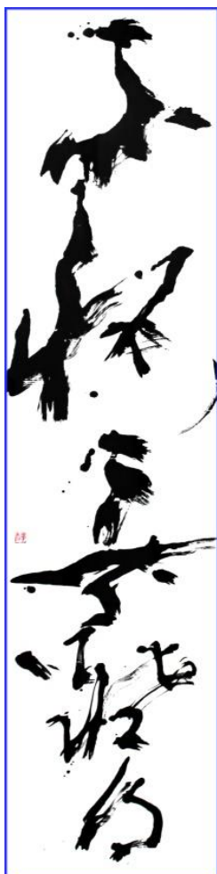
「不悟者難得」 大樂華雪